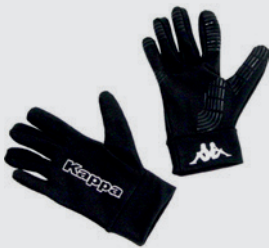
Gants Kappa MANO