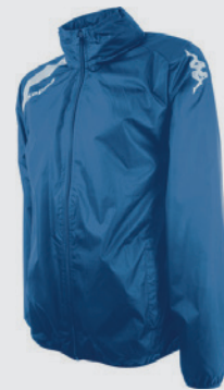
Coupe-vent Kappa VADO