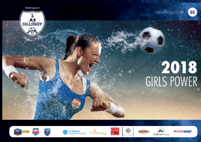
Calendrier du club