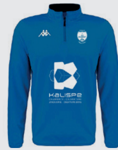
Sweat ½ zip TAVOLE