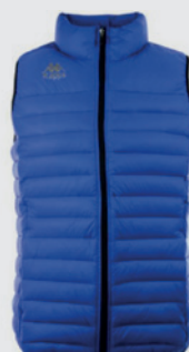
Doudoune Kappa DREZZO