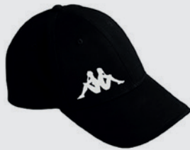
Casquette Kappa VIGOLENO