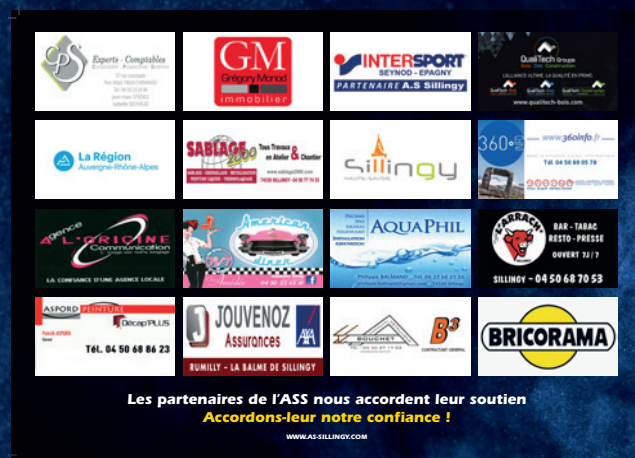
Sets de table