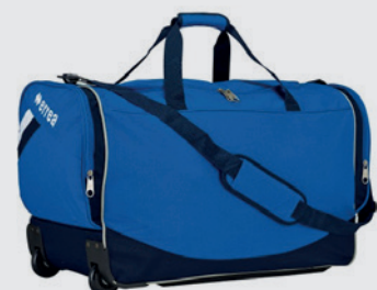
Sac à roulettes Errea

NB : Les équipements sont floqués avec le logo et les partenaires du club.