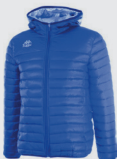
Doudoune Kappa DASIO