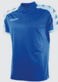
Polo Kappa TINASIO