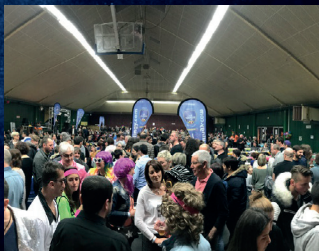
Soirée du Club