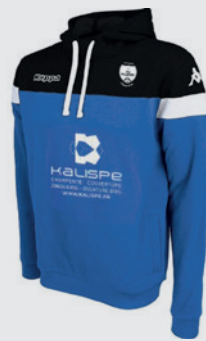
Sweat à capuche ACCIO