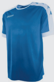
Maillot Kappa TANIS