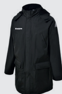
Parka Kappa MATEO