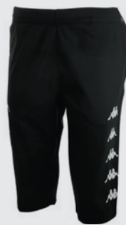
Pantacourt Kappa BARDINO