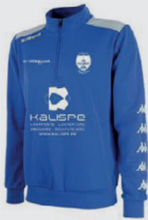
Sweat ½ zip SACCO